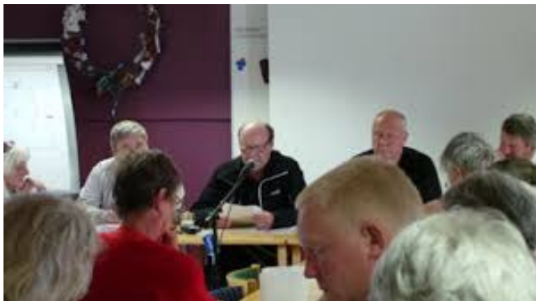
SKPs fackliga seminarium med deltagare från Sverige, Danmark och Norge.

Hur EU kramarna i Byggnads förbundsledning tänkt sig att knäcka den nöten kan inte bli annat än mycket intressant att se.