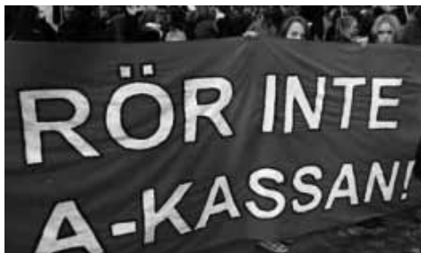
Från demonstrationerna mot försäkringarna i A-kassan 2006, därefter har det varit tyst från facken...

Något annat som alltid måste diskuteras och som det är alldeles för tyst om, det är A-kassan. Att det är meningslöst att via avtalsrörelsen kräva en höjning av A-kasse ersättningen, det vet även vi kommunister. Däremot så är vi av den uppfattningen att Byggnads är alldeles på tok för tysta när de arbetslösa kamraterna på grund av en cynisk och arbetarfientlig regering knappt har mat för dagen då ersättningen vid ofrivillig arbetslöshet är rena hånet. I och med den nya organiseringen i Byggnads med 11 regioner så finns det i förbundsstyrelsen 1 representant från varje region. Se till att förbundsstyrelsen blåser på i frågan om A-kassan och inte låter sig tystas med socialdemokraternas löfte om att de ska se över frågan.