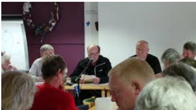
SKPs fackliga seminarium med deltagare från Sverige, Danmark och Norge.

Hur EU kramarna i Byggnads förbundsledning tänkt sig att knäcka den nöten kan inte bli annat än mycket intressant att se.